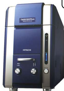
(体験機器イメージ)